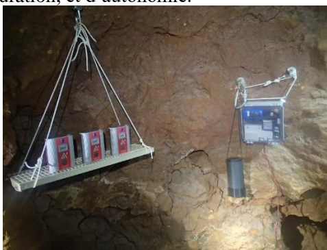
De gauche à droite AER+, Glog, et capteurs « Laplaud »